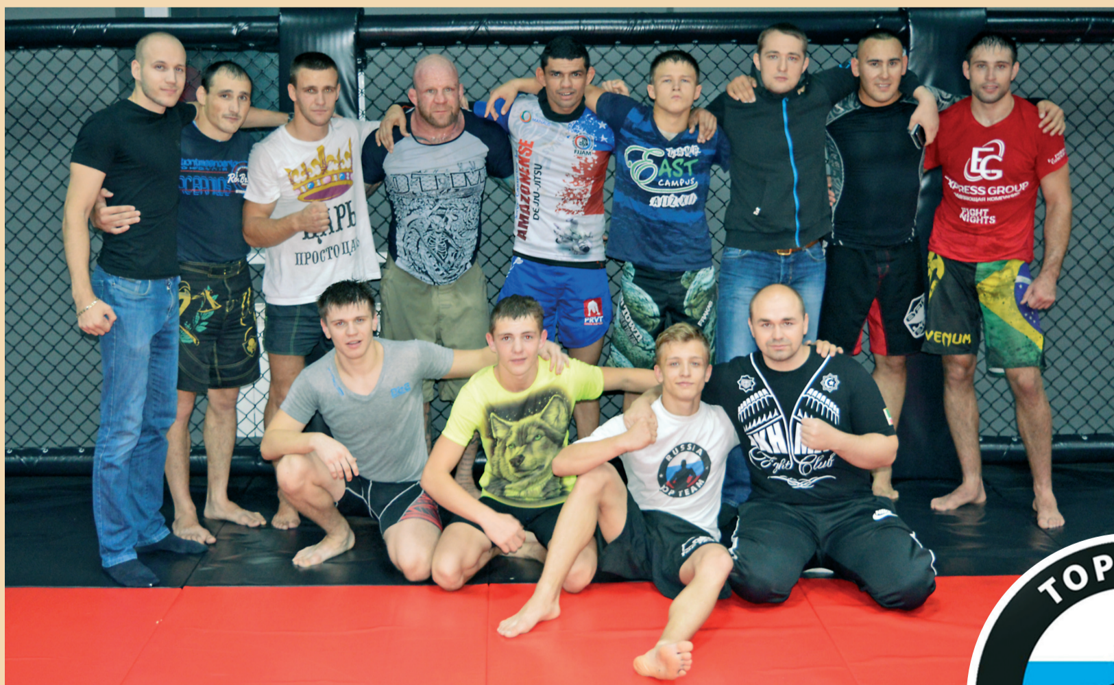
TopTeamSiberia — актив клуба